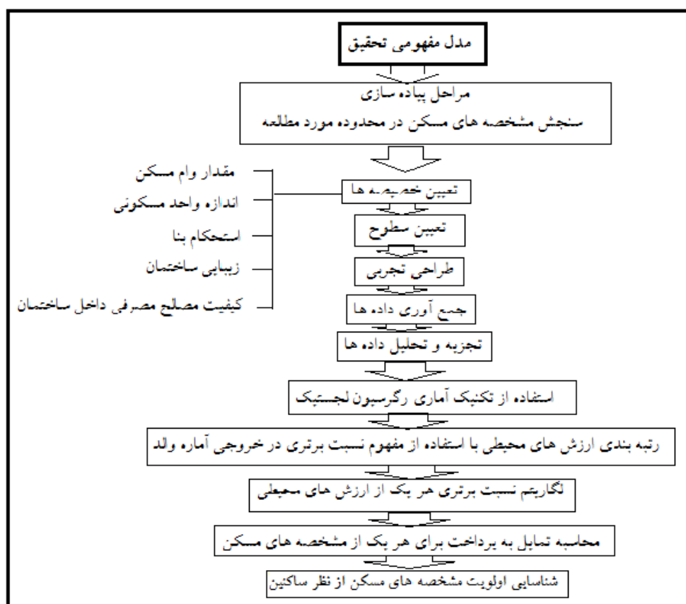
نمودار ۱. مدل مفهومی تحقیق

مصاحبه کننده پس از توضیح مشخصات دو گزینه از فرد می‌خواهد که با توجه به مشخصات واحد مسکونی، از بین دو گزینه یک گزینه را انتخاب کند. این ۸ سناریو به سه قسمت تقسیم شد و در هر روستا ۳۰ پرسشنامه پر شد. در ۲۰ مورد از این ۳۰ پرسشنامه سوالات ۳ گزینه‌ای و ۱۰ مورد دیگر سوالات ۲