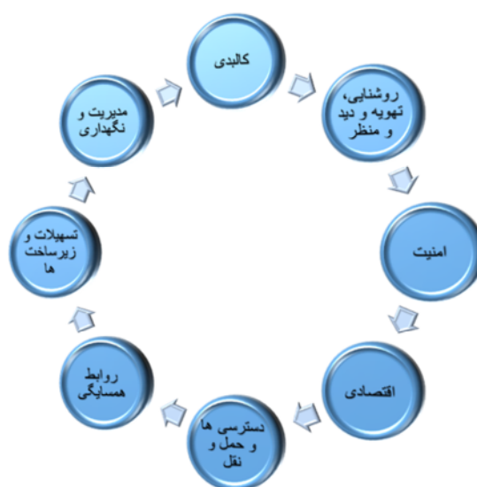
نمودار ۱. مدل مفهومی تحقیق براساس رضایتمندی از مسکن مهر