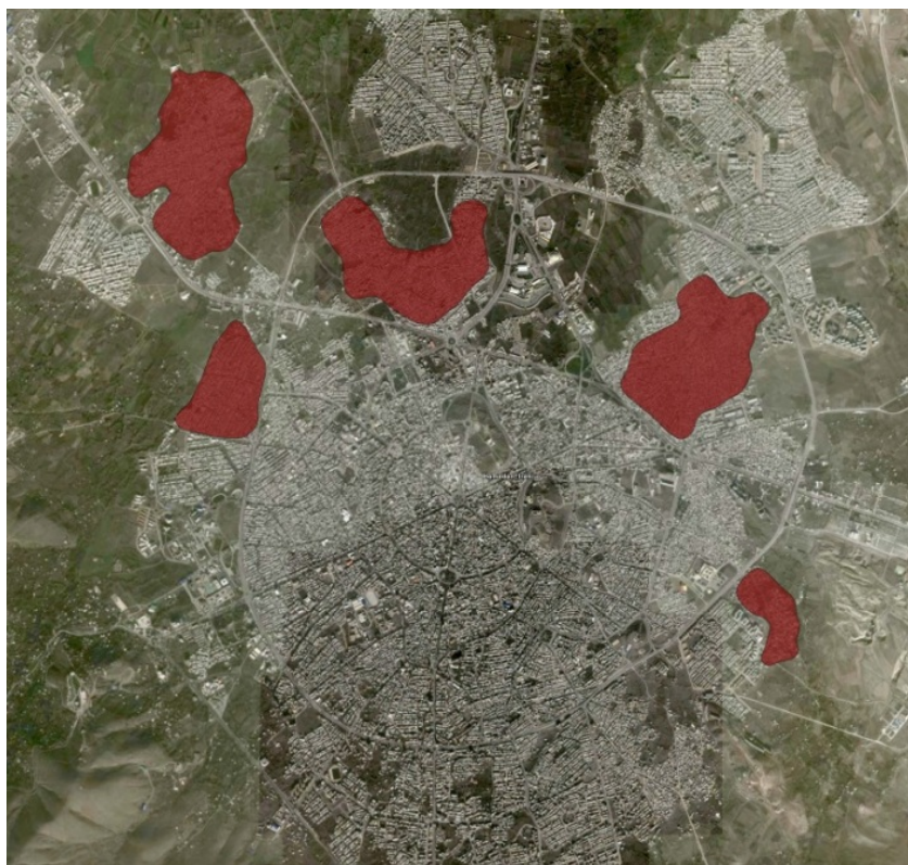
شکل ۱: موقعیت سکونتگاه‌های غیررسمی در شهر همدان