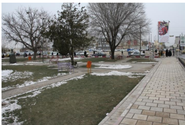
شکل ۸: فضای سبز واقع در حاشیه معبر پیاده (روبه روی عمارت ذوالفقاری)