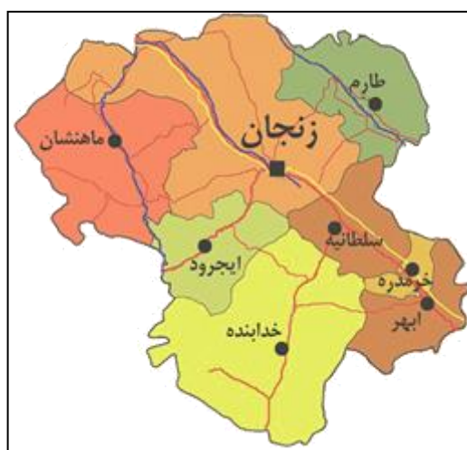
شکل ۱: موقعیت شهر زنجان در استان

شهر زنجان در ۴۸ درجه و ۲۸ دقیقه طول شرقی و ۳۶ درجه و ۴۰ دقیقه عرض شمالی و در بلندی متوسط ۱۶۵۰ متری از سطح آب‌های آزاد با مساحتی حدود ۶۴۰۰ هکتار و در ۳۱۹ کیلومتری شمال غربی تهران و در ۲۸۰ کیلومتری جنوب شرق تبریز قرار دارد. (سعیدیان، ۱۳۷۹: ۴۷۱).