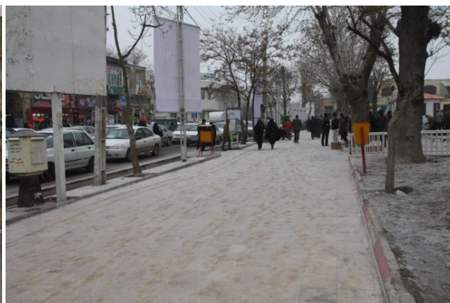
شکل ۶: کفپوش‌های ناسازگار با اقلیم سرد منطقه