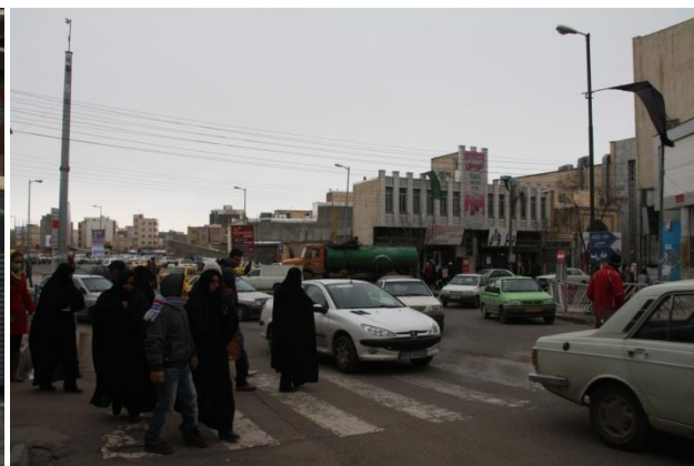
شکل ۴: تداخل پیاده و سواره (عدم ایمنی)