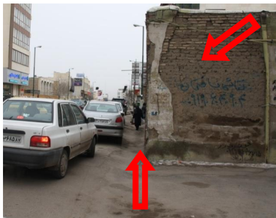
شکل ۷: انسداد معبر پیاده (عدم آزادسازی معبر)