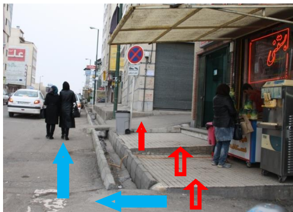
شکل ۵: معابر پلکانی، مزاحم عبور پیاده