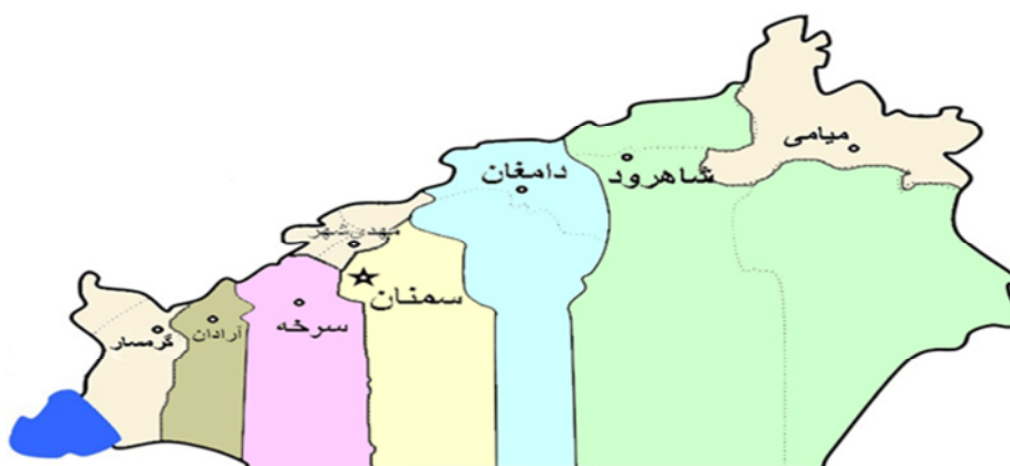
شکل ۱: نقشه استان سمنان