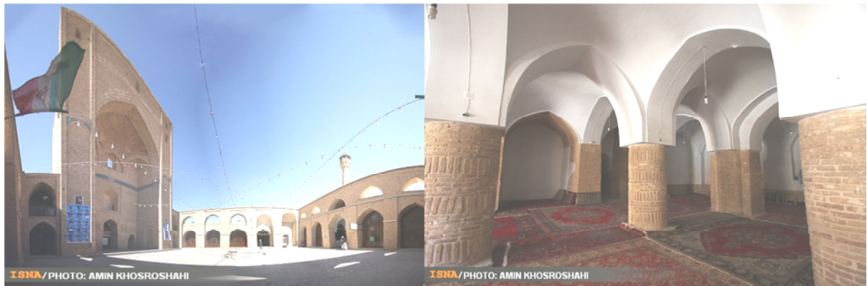
شکل ۲: نمایی از مسجد جامع سمنان

سمنان یکی از کهن‌ترین شهرهای ایران زمین بوده و قدمت آن به پیش از دوره اسلامی می‌رسد. شهر سمنان در عهد ساسانیان نیز وجود داشته و در فتوح مسلمین از آن نام برده شده است. امروزه نیز محله‌های بسیار قدیمی در شهر سمنان وجود دارد که می‌توان از جمله به کهنه دژ اشاره نمود که در داخل محله تاریخی ناسار قرار گرفته است که آثار همان بخش حاکم نشین دوران ساسانیان است. استقرار شهر در مسیر جاده ابریشم که از چین تا مدیترانه امتداد