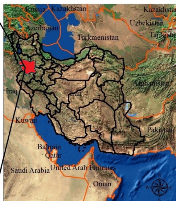
شکل ۱. موقعیت دریاچه زریبار در نقشه استان