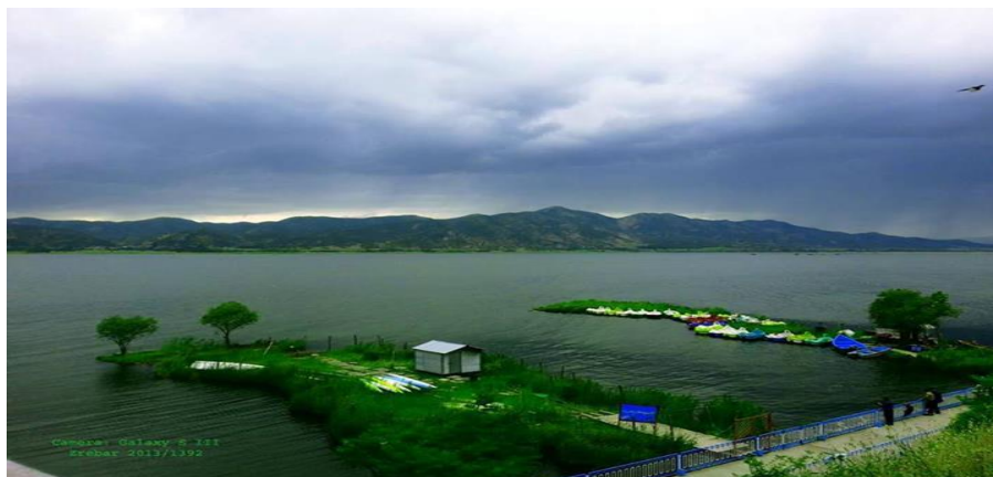
شکل ۲. تصاویری از دریاچه زریبار