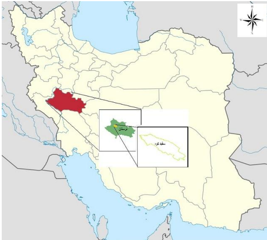
شکل ۱. موقعیت منطقه حفاظت شده سفیدکوه خرم‌آباد در کشور و استان

ارتفاعات سفیدکوه محدود می‌شود (نظری و آقاپورصباغی، ۱۳۹۳).