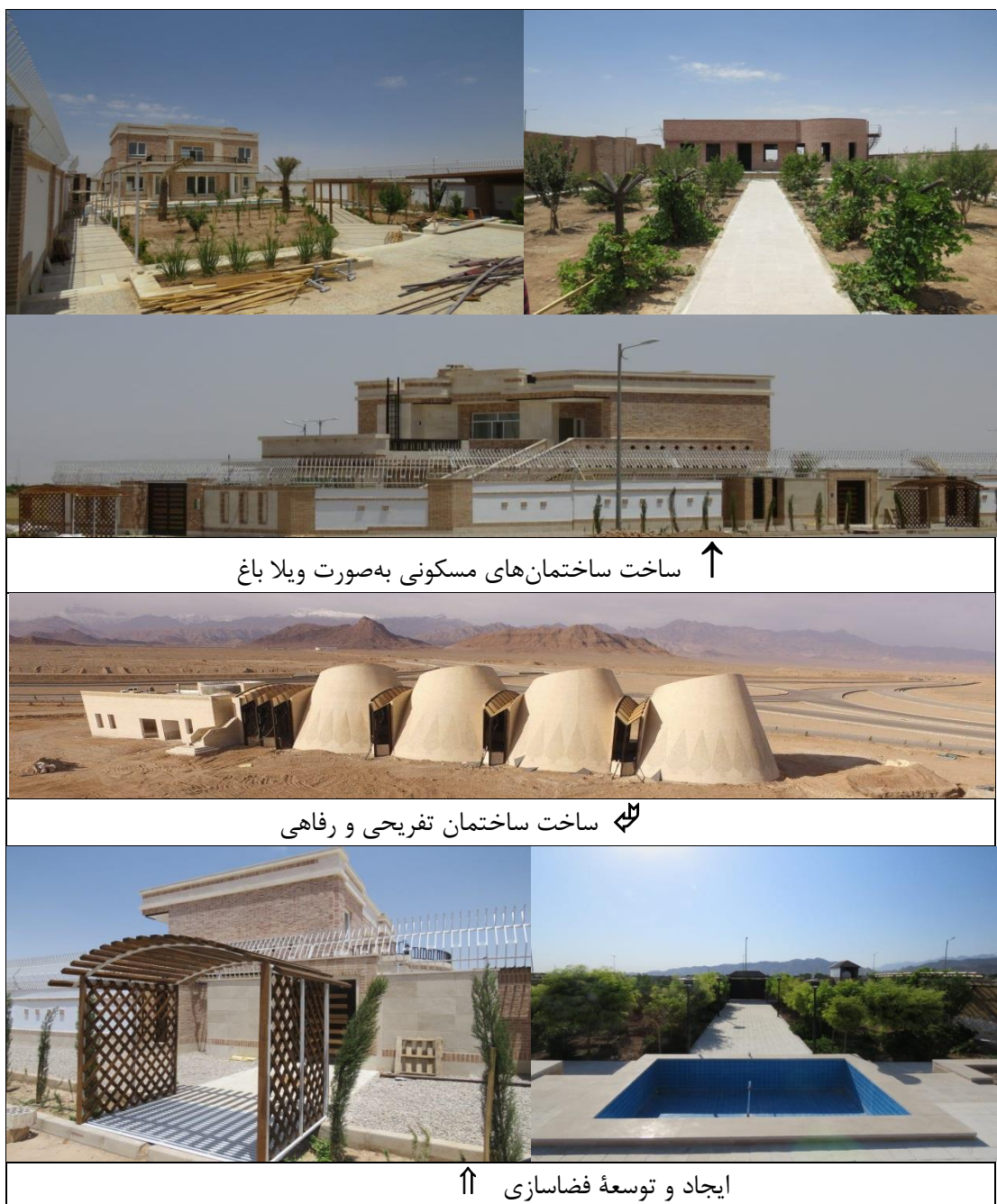
شکل ۳. اجرای برخی از زیرمعیارهای مرتبط با فضاسازی و ساختمان‌سازی با استفاده از فاضلاب خاکستری