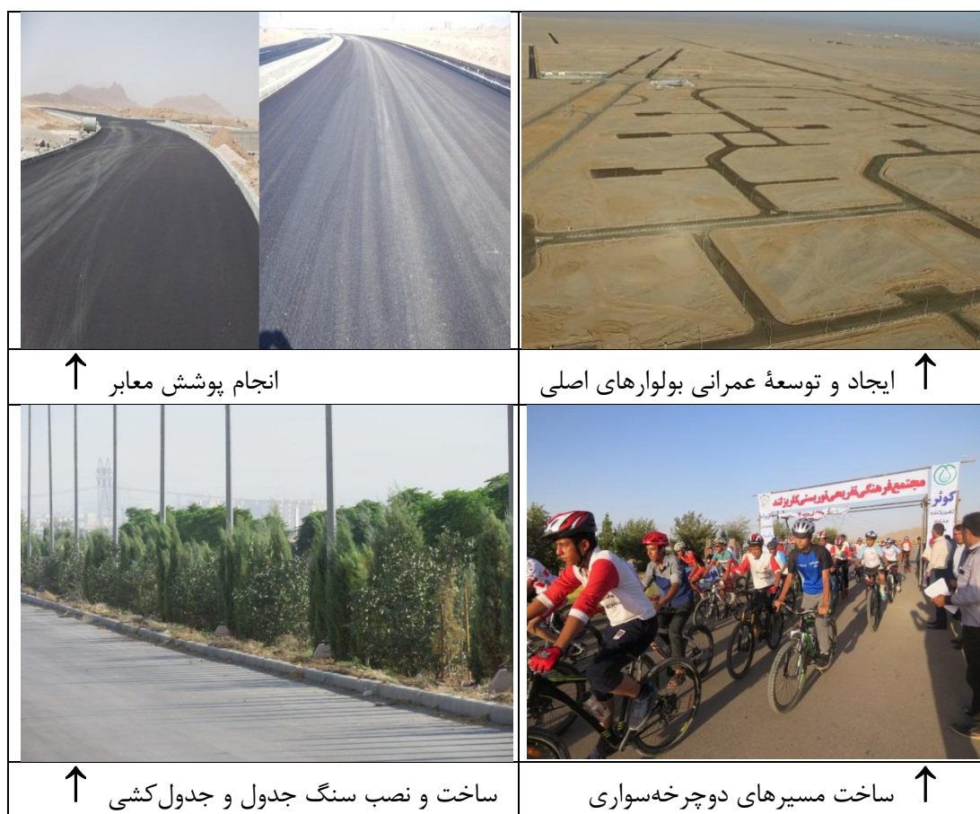
شکل ۲. اجرای برخی از زیرمعیارهای مرتبط با راه و حمل و نقل با استفاده از فاضلاب خاکستری