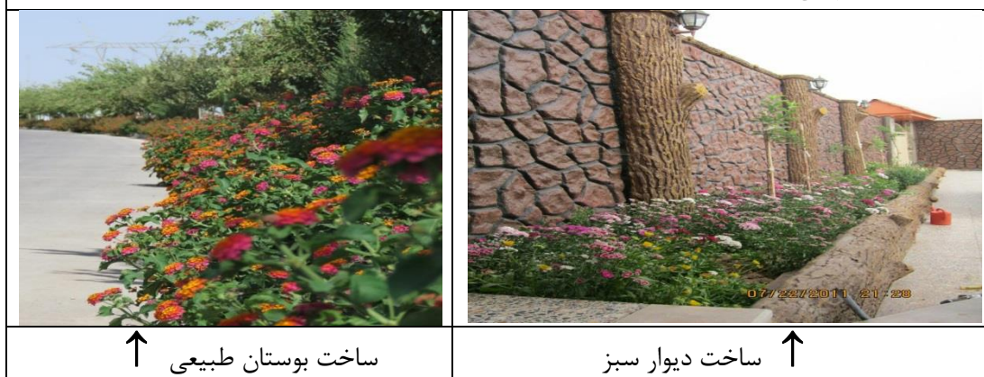
↑ ساخت بوستان طبیعی