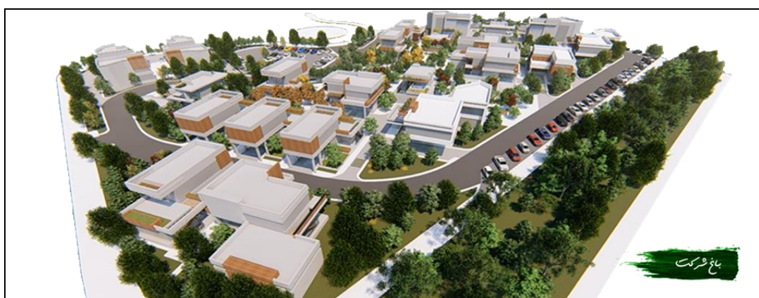
پلان سه‌بعدی جاذبه‌های گردشگری در باغشهر (در دست احداث)